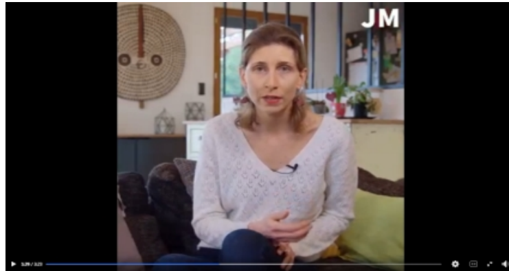
Syndicat des Jeunes Médecins