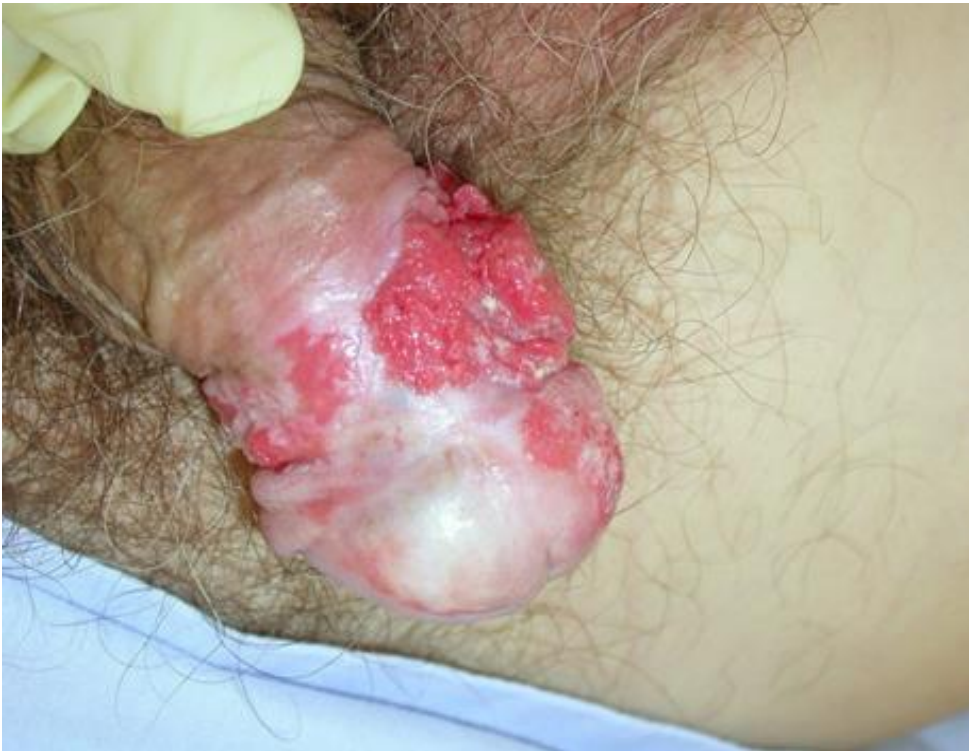
Carcinome micro invasif HPV HR+