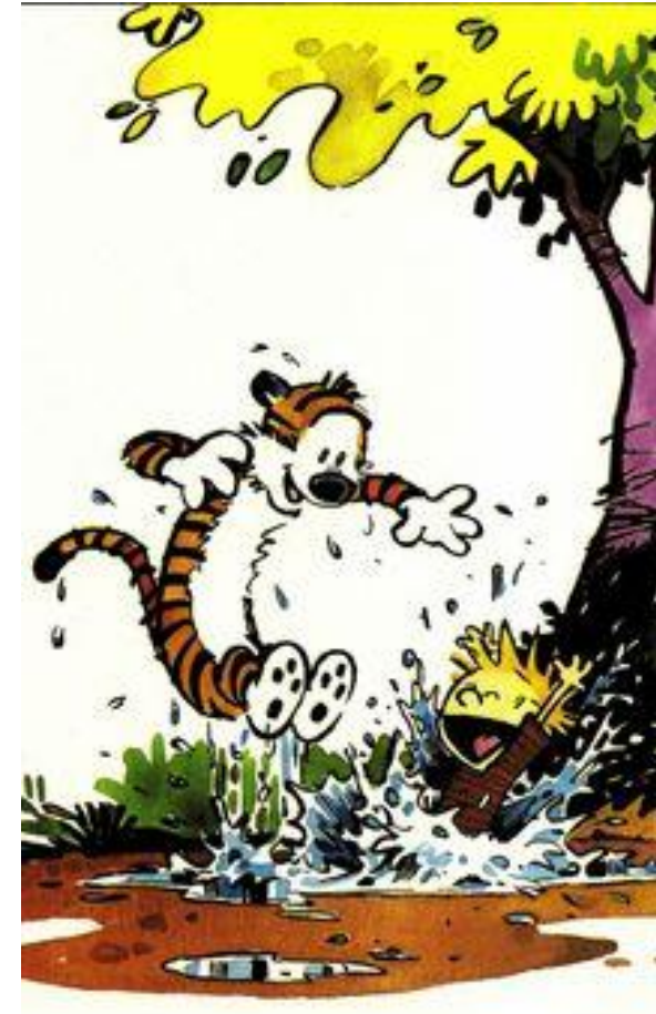
« Calvin and Hobbes » de Bill Watterson